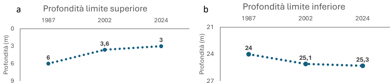
Fig. 4 – (a) Profondità del limite superiore e (b) del limite inferiore della prateria di P. oceanica rilevata nei tre anni di monitoraggio. (a) Depth of the upper limit and (b) of the lower limit of the P. oceanica meadow recorded during three monitoring years.