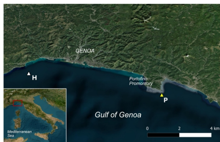
Fig. 1 – L'area di studio con i due siti di campionamento (H) Haven; (P) Boa Meda-2 Portofino. The study area with the two sampling sites (H) Haven; (P) Boa Meda-2 Portofino.