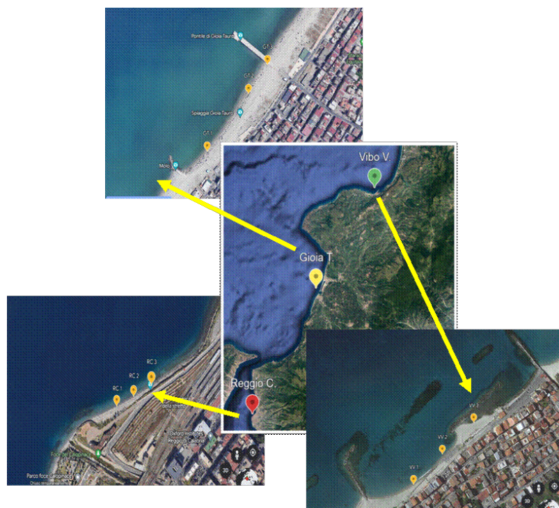
Fig. 1 - Siti campionati lungo la fascia costiera calabrese. Stations sampled along the Calabrian coastal zone.

Risultati - I valori di temperatura sono oscillati tra 17,6 e 19,8°C in autunno e 26,7 e 35,4°C in estate; quelli di salinità tra 31,6 e 37,53 psu e fra 30,4 e 37,70 psu nelle stesse stagioni, rispettivamente (dati non mostrati). L'andamento dei tassi di attività enzimatica misurati nelle tre matrici analizzate è mostrato in Fig. 2. Sono stati osservati livelli di attività microbica differenti in base alla matrice analizzata, con incrementi generalmente osservati nella stagione estiva per tutti gli enzimi esaminati. In generale, i valori dei tassi enzimatici hanno seguito un gradiente decrescente nell'ordine LAP>AP>GLU, suggerendo processi di decomposizione più attivi sulla componente proteica rispetto ai fosfati organici e ai polisaccaridi.